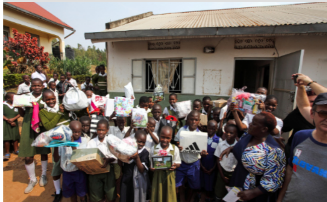
DETI V ŠKOLÁCH SI PREBERAJÚ DARČEKY OD SPONZOROV