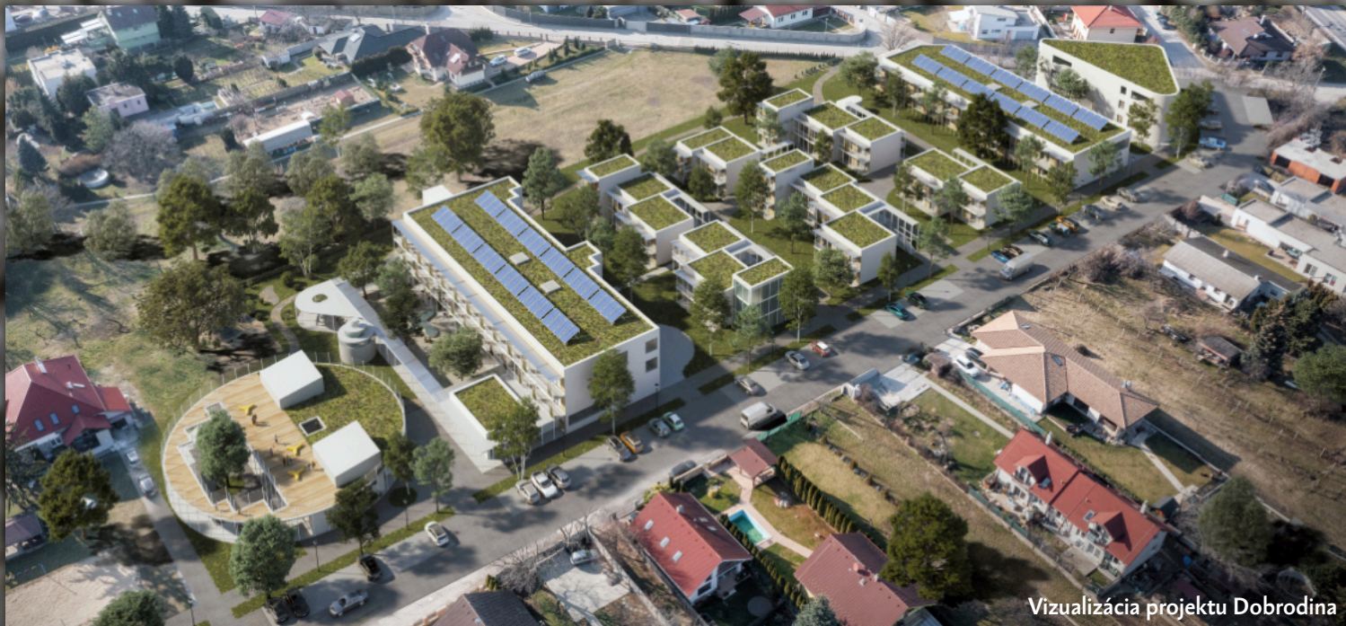
Vizualizácia projektu Dobrodina