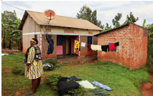
JEDEN Z MÁLA DOMČEKOV KTORÝ MÁ AJ ELEKTRIKU