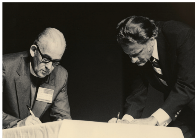
Billy Graham a John Stott pri podpise zakladajúcej zmluvy v r. 1974

V dejinách kresťanstva sa odohralo viacero významných udalostí, ktoré boli uznané ako cirkevné koncily,