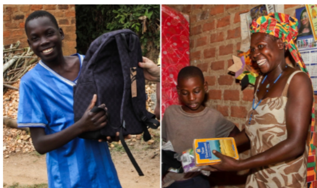
MEDZI DARČEKMI JE AJ NOVÝ ZÁKON