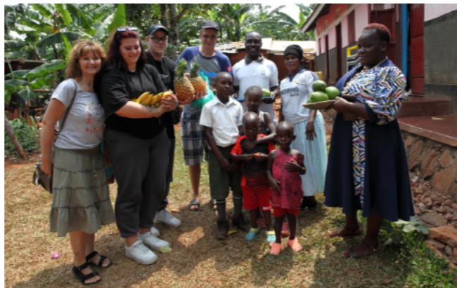
KAŽDÁ RODINA NÁM PRIPRAVILA PREKVAPENIE V PODOBE DARČEKOV