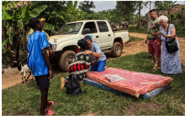
DOMÁCI PRIJÍMAJÚ DARY NA KOLENÁCH