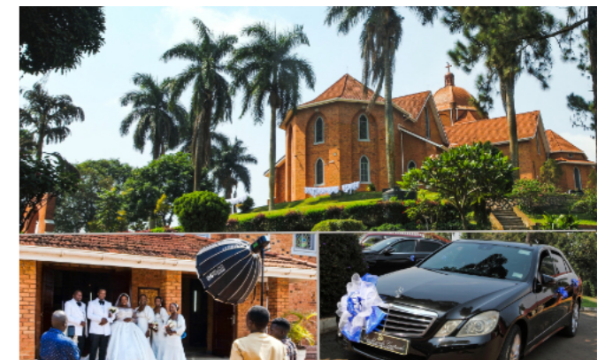
Boli sme svedkami luxusnej svadby v katedrále Namirembe.