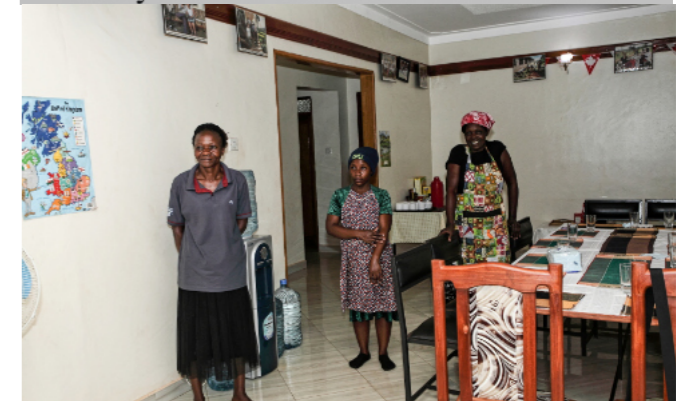
Naši hostitelia nás srdečne privítali a ponúkli nám slovenské menu.