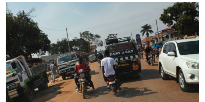
Rušný život na cestách. Jazdí sa tu vľavo.