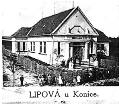
LIPOVÁ u Konice.